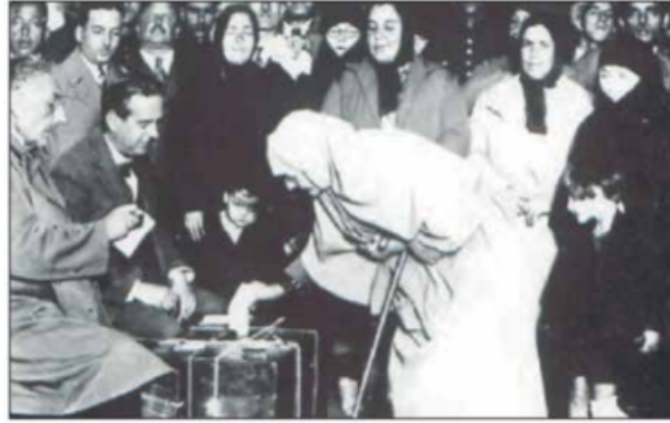
1935 Milletvekili Seçimlerinde Vatandaşlar Oy Kullanırken

Bu fotoğraf dikkate alındığında Cumhuriyetin ilk yılları için,