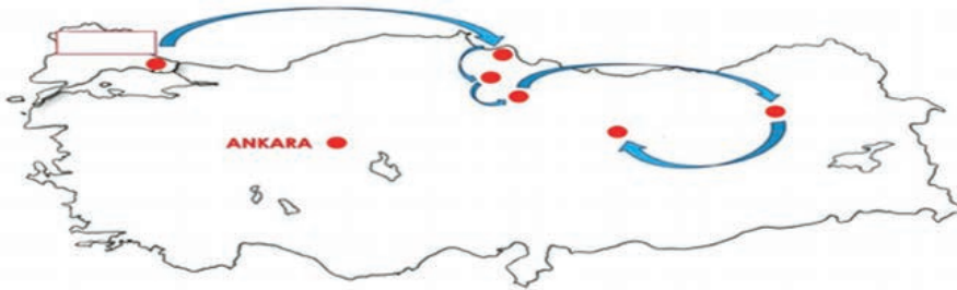
KURTULUŞ SAVAŞI HAZIRLIK SÜRECİ ( 1919)

Millî Mücadelenin hazırlık sürecinde yayınlanan genelge ve düzenlenen kongrelerin kronolojik sıralaması hangi seçenekte doğru olarak verilmiştir?